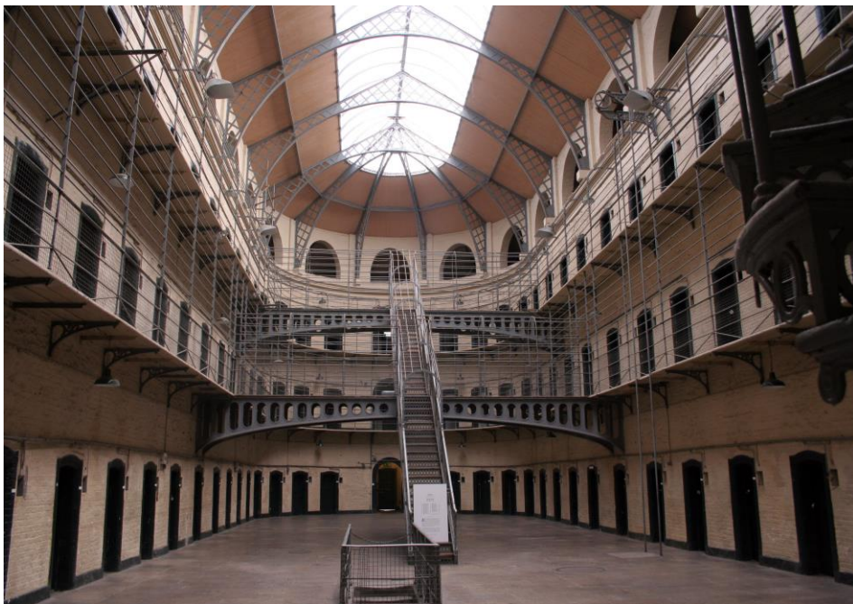
Это изображение, автор: Неизвестный автор, лицензия: CC BY-SA