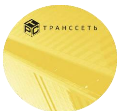
КОМАНДА 12 чел ТРАНСЦЕТЬ